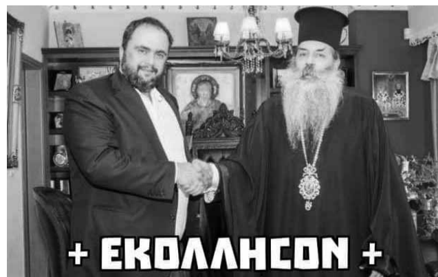
Μια από τις πολλές αναρτήσεις στα μέσα κοινωνικής δικτύωσης, μετά τη δήλωση Μαρινάκη ότι τον «επικέκτησε» ο κοροναϊός.