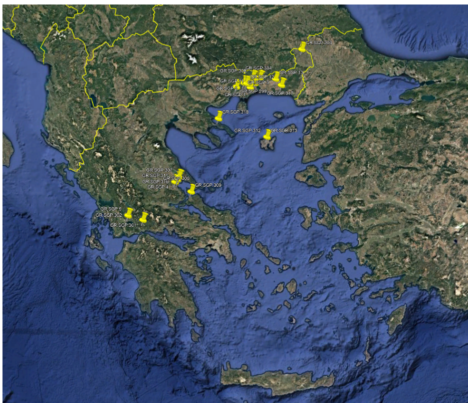
Εικόνα 1. Εστίες Ευλογίας (Αναφορές ADIS Αρ. 2024/299 έως 2025/005).

Κατόπιν διαβούλευσης με τις αρμόδιες υπηρεσίες της Ευρωπαϊκής Επιτροπής, πρόκειται να ενσωματωθούν στο Παράρτημα της Εκτελεστικής Απόφασης, αναφορικά με ορισμένα μέτρα έκτακτης