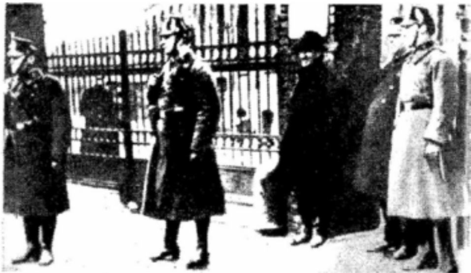
Ο Χίτλερ χαφιάς, φωτογραφία από γαλλική εφημερίδα το 1923

στα μετόπισθεν του γερμανικού στρατού, τρομοκρατώντας με λεηλασίες, βιασμούς και δολοφονίες τον άμαχο σλαβικό πληθυσμό. Η βασική ιδεολογική θέση αυτών των αποβρασμάτων συνοψίζεται στο σύνθημα «Πισώπλατο Χτύπημα». Θεωρούσαν ως βασικούς υπεύθυνους για την ήττα της Γερμανίας στον Α΄ Παγκόσμιο Πόλεμο τους μπολσεβίκους, τους εβραίους και τους σοσιαλδημοκράτες. Στο μέλλον έπρεπε να εκδικηθούν για την ήττα της Γερμανίας, εξοντώνοντας τους εργατικούς ηγέτες και επιβάλλοντας μια εθνική φασιστική ηγεσία που θα αναγεννούσε το Τρίτο Ράιχ από τις στάχτες του. Εμπνευστής αυτής της θεωρίας ήταν ο ίδιος ο στρατάρχης Εριχ Λούντεντορφ, που έλαβε μέρος μαζί με τον Χίτλερ στο πραξικόπημα της μπιραρίας το Νοέμβριο του 1923. Αρκετά στελέχη των μετέπειτα ναζί ήταν πρώην μέλη των Φράικορps. Το 1919, ο Χίτλερ εκτελούσε χρέη πράκτορα του γερμανικού επιτελείου, παρακολουθώντας τις συζητήσεις των εξεγερμένων εργατών στα σοβιέτ του Μονάχου.