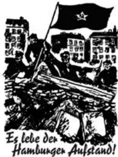
Ζήτω η εξέγερση του Αμβούργου!

Ο θρύλος του κόκκινου Αμβούργου θα στοίχειωνε για πολύ ακόμη τον ύπνο των αστών και του βασικού πολιτικού τους στηρίγματος, πλέον, των σοσιαλδημοκρατών ηγετών.