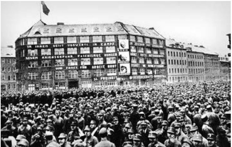
Διαδήλωση των SA μπροστά στα κεντρικά γραφεία του KPD

Στην εκλογική αναμέτρηση του Νοέμβρη του 1932, πέντε μέρες μετά την έναρξη της απεργίας των μεταφορικών, το ποσοστό των ναζί έπεφτε στο 33%. Οι ναζί έχαναν 2.000.000 ψήφους, χωρίς καν να έχουν συμμετάσχει σε κυβερνητικό σχήμα. Αντιθέτως, το KPD έπαιρνε άλλες 600.000 ψήφους από το SPD, φτάνοντας στο 16.9% και τα 6.000.000 ψήφους συνολικά. Το SPD, αντιθέτως, έπεφτε στα 7.200.000 ψήφους με ποσοστό 20.4%. Τα αποτελέσματα αυτά έφεραν τον πανικό στα επιτελεία του μονοπωλιακού κεφαλαίου. Πλέον,