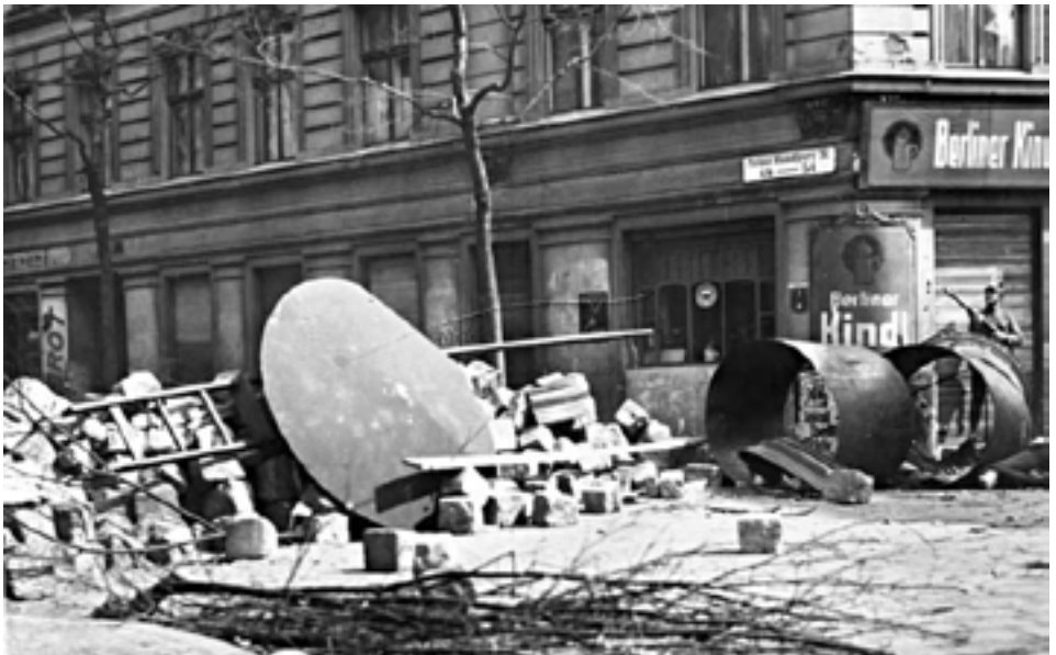
Οδοφράγματα που έστησαν 3000 εργάτες στη Briesestrasse.

Εημέρωνε η Πρωτομαγιά του 1929. Από το πρωί άρχισαν οι προσυγκεντρώσεις των απεργών στα προάστια του Βερολίνου και γύρω από το κέντρο. Προς το μεσημέρι πάνω από 200.000 εργάτες δοκίμασαν να προσεγγίσουν την Αλεξάντερ Πλατς από διαφορετικές κατευθύνσεις. Εξω από το μέγαρο της αστυνομίας άρχισαν άγριες συγκρούσεις. Διμοιρίες των μπάτσων προσπαθούσαν συνεχώς να διαλύσουν τους απεργούς και να τους τρέψουν σε φυγή. Μάταια.